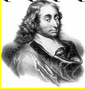
Institution Blaise Pascal